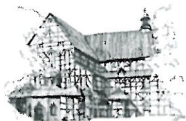
Kościół Pokoju pw. Św. Trójcy Wpisany na listę UNESCO

dot. uzupełnienia „Informacji o gospodarce nieruchomościami”