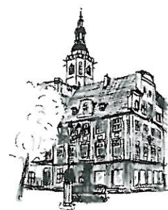
Rynek Wieża ratuszowa

Proszę o dołączenie do „Informacji o gospodarce nieruchomościami” dodatkowej strony nr 20a.