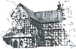
Kościół Pokoju pw. Św. Trójcy Wpisany na listę UNESCO

Proszę o wprowadzenie do porządku obrad LIV Sesji Rady Miejskiej w Świdnicy, planowanej na dzień 26 maja 2023 r., projektu uchwały w sprawie udzielenia z budżetu Miasta Świdnicy na 2023 r., dotacji celowych na planowane prace konserwatorskie, restauratorskie i roboty budowlane przy zabytkach zlokalizowanych na terenie Świdnicy, wpisanych do rejestru zabytków lub znajdujących się w gminnej ewidencji zabytków.